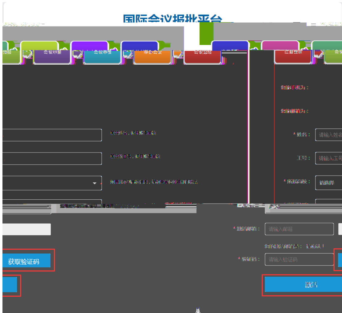
图 1.4 国际会议报批平台激活页面