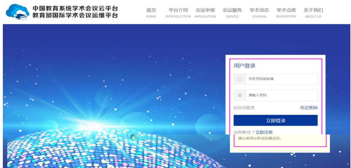
图 1.3 主平台登录界面

第二步：（注册成功后系统自动回到“中国教育系统学术会议云平台”）点击“登录”进入主平台登录界面如图 1.3，输入注册的账号和密码点击“立即登录”。