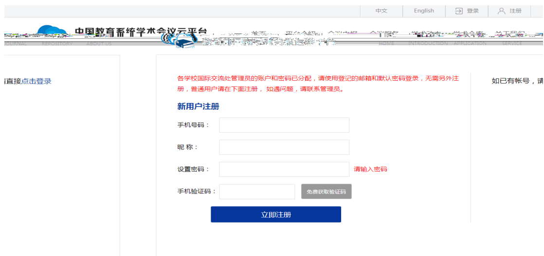
图 1.2 主平台注册界面

第二步：（注册成功后系统自动回到“中国教育系统学术会议云平台”）点击“登录”进入主平台登录界面如图 1.3，输入注册的账号和密码点击“立即登录”。