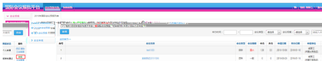
图 3.1 国际会议预报到申报

国际会议预报审核通过后，用户可以进行国际会议申报。步骤是：点击会议预报申报--》2019年会议预报--》进入预报列表点击对应会议操作栏中的“申报”按钮，如图 3.1，即进入国际会议申报流程。按要求填写国际会议申报表单后点击“提交”完成申报。