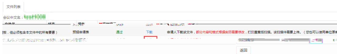
图 2.2.3 文件列表学院预报表上传页面

国际会议预报表下载、打印签字盖学院公章扫描后，需要将扫描件上传，点击“上传”按钮上传学院预报表（国际会议预报申请表签字盖章的扫描件），如图 2.2.3。 注：在单位初审审核之前可以修改上传的扫描件。