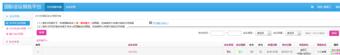
图 2.2.1 国际会议预报列表-文件管理页面

国际会议预报申请提交后，点击预报列表操作栏的文件管理，如图 2.2.1，进入文件列表页面如图 2.2.2，点击“下载”按钮下载国际会议预报申请表（部分内容和格式根据实际需要修改），打印签字盖学院公章扫描后待用。